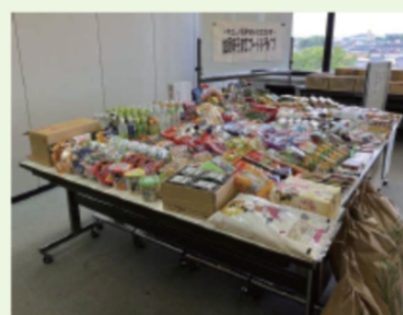
加須市子育てフードドライブの様子

加須市では、2020年1月から加須市役所がフードドライブを開始し、現在では、8団体が「子育て応援パートナー」としてフードドライブを開催している他、数多くの地元企業や市民の皆さんが「子育て応援サポーター」として私たちの活動を支援してくれています。市民相互の信頼と絆で、加須市の子どもたちの未来を応援します。