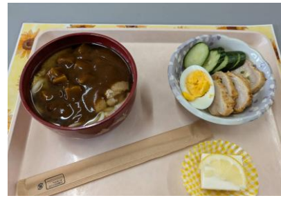
【昼食】カレーうどん、チキンロール&卵、レモンチーズケーキ 焼きおにぎり（食べたい子には）

アート体験教室4回めで、とうとう虹7色完成しました！完成した作品を乾かして、広場の天井にみんなで飾りました。お部屋に大きな虹がかかり、さらに楽しい空間になりました。カービーのピンクの胴体も完成し、後は細かなパートづくり・・・こちらも「夏ボラ」中学生に手伝ってもらい、もうすぐ完成です。達成感を味わいつつ、大きな虹の下でみんなで昼食を食べました。